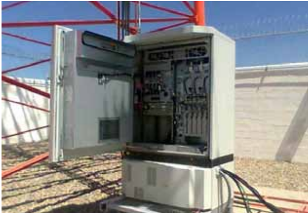
Överspänningsskydd för radiobasstation.