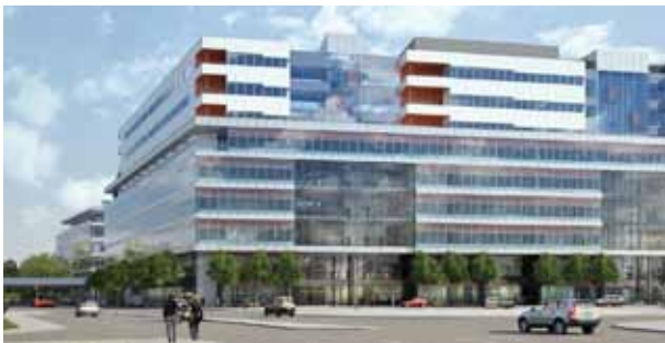
Åskledarsystem och potentialutjämningsystem.

Detta samarbete utmynnade i bl a ED150 skyddet som var världens första grov/-finskydd. Installerat i 100 000-tal över hela världen.