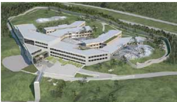
UPS system (2x160kVA), åskledare, jordningsmaterial samt överspänningsskydd.

Dessutom levererade vi UPS'er och överspänningsskydd för en komplett elsäkerhet.