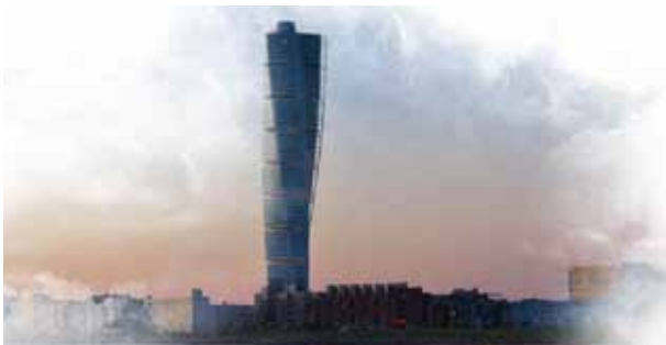
Färganpassat åskledarsystem, potentialutjämnings-system, överspänningsskydd samt UPS.

Elrond är huvudleverantör av potentialutjämningsmaterial och åskledar-material.